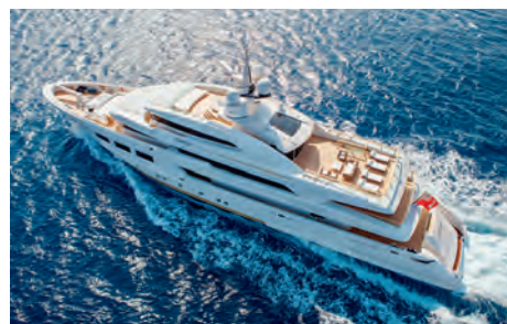
Вверху Палубные планы яхты. Слева Как только владелец получил яхту, он отправился на ней в первое путешествие по Средиземному морю.

на самый верх, на предусмотрительно огороженную стеклом sundeck , в самом центре которой находится джакузи. Строительство этого судна, на верфи CRN проходившего под кодовым названием «борт №133», продолжалось больше года. Заказчику красавицу Saramour доставили в самом конце мая, а акваторию Анконы она покинула 4 июня. Кстати, у вас есть все шансы увидеть эту яхту своими глазами, если этим летом вы отдыхаете на Средиземном море: счастливый владелец и его семья уже отправились в первое путешествие. ≈